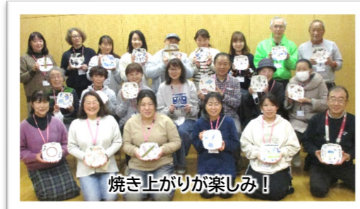
焼き上がりが楽しみ!