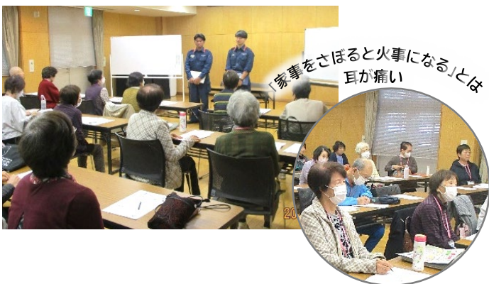
「家事をさぼると火事になる」とは耳が痛い

学びの最後は家庭における事故への備えとして、相模原市南消防新磯分署の署員を招いてお話を伺いました。昨年度の犠牲者は1,436名。住宅用火災報知器の設置により住宅火災が6割減少するといえます。「家電製品や延長コードのほこりが発火」「コンロの油汚れに火が燃え移った」等、整理整頓や清掃で火災発生原因を取り除くことができると学びました。火災報知器の効果の目安は10年です。定期的な点検と、日ごろのちょっとした注意で、安全に暮らしましょう。