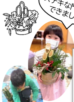
ノコギリは慎重に