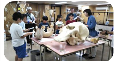
ゾウの頭。この肌の骨は触れます！