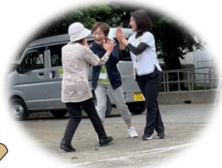
3人1組 仲間と楽しく♪

モルックとは、フィンランドのカレリア地方の伝統的なキョック (kyökkä) というゲームを元に Lahden Paikka 社 (当時 Tuoterengas 社) によって 1996 年に開発されたスポーツです。(※一般社団法人日本モルック協会より抜粋)