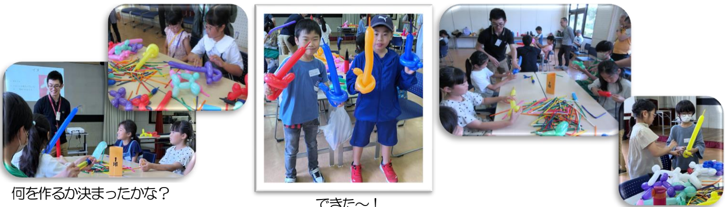
何を作るか決まったかな？