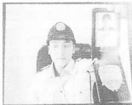
実際に使われたニセ警察官の画像 (画像の一部を加工、警視庁提供)

警察がメールや各種SNSで警察手帳や逮捕状をアップしたり、インターネットバンキングで口座を開設するように指示することは絶対にありません!!警察がお金やキャッシュカードを要求することは絶対にありません!不審な電話がかかってきたら、話を鵜呑みにすることなく、一旦切って、家族や警察に相談しましょう。