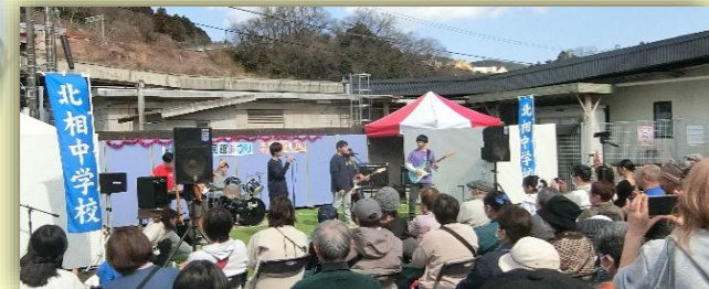
北相中学校生活文化部のみなさん