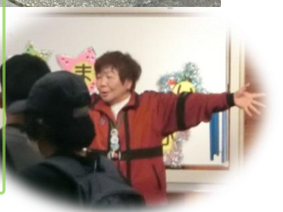
みんなありがとう！