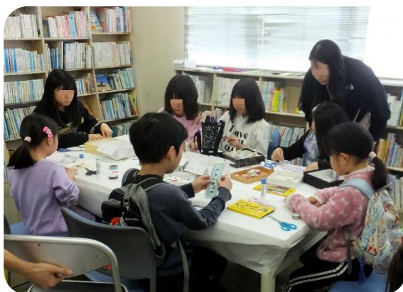
図書室でしおり作り

がつていました。2日目の催しものは6種、午前10時から午後3時まで30分単位のイベントでしたので、2階のロビーは出演者や観客の入れ替わりなどであふれていました。