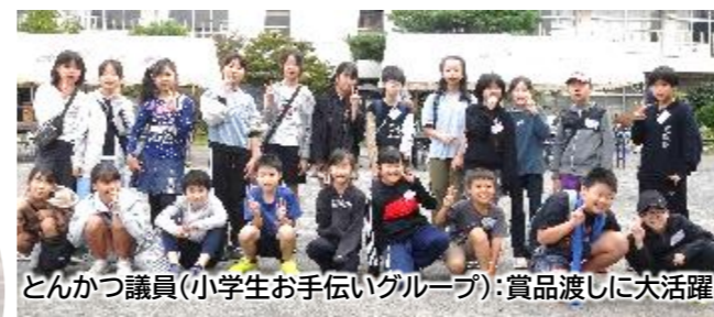
とんかつ議員(小学生お手伝いグループ): 賞品渡しに大活躍

自治会対抗方式をやめて、すべての種目が自由参加となりました。友達同士で、家族で、近くの方とお誘いあわせて、競技を楽しみました。ゴールテープを目指して走る姿にみんながエールを送り、たくさんの笑顔あふれる第1回となりました。