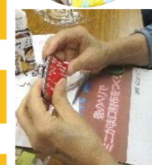
実印を入れるのにちょうどいい大きさ

9月11日(木)から始まった全9回のさくら楽級の第6回目、参加者は28名でした。畳のへりは、手芸用のものを岡山県から取り寄せたそうです。たくさん柄のなかから、表と裏の2柄を、和気藹々と選んでいました。