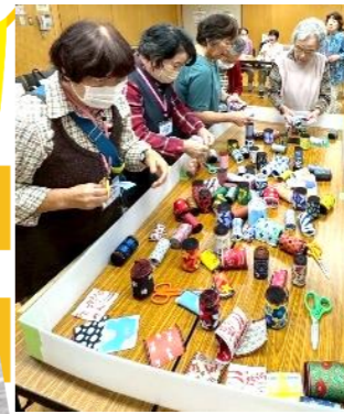
たくさんの種類の畳のへりに、選ぶだけでわくわく！