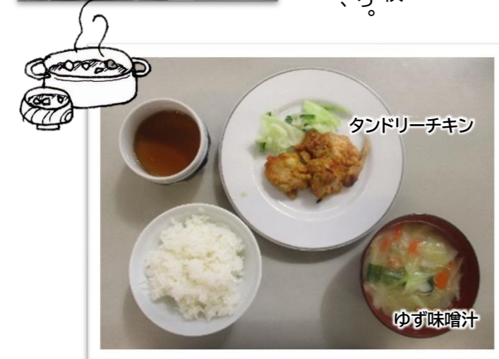
タンドリーチキン