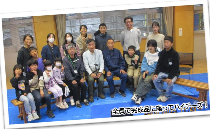
全員で完成品に座ってハイチーズ！