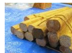
準備の整った材料