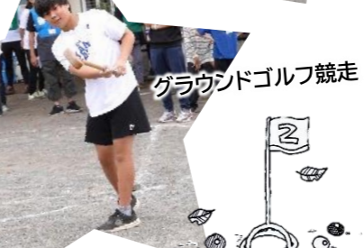
グラウンドゴルフ競走