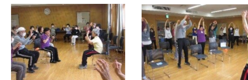
健康づくり普及員主催事業の元気倶楽部の様子