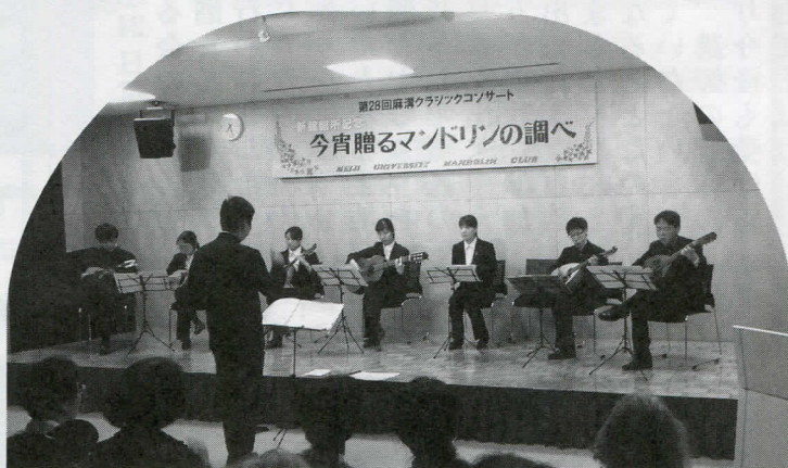
若き世代が奏でる世界の名曲と懐かしのメロディーの数々

この事業では、毎回入場料の一部が震災被災地への募金に充てられています。会場前の廊下には「東日本大震災から8年」と題したパネル展示も行われ、被災地からの礼状や関連する新聞記事により、震災を風化させない願いを込めた公民館からの情報が発信されました。