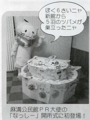
ほく6さいニヤ 新館から 5羽のツバメが 巣立ったニヤ

模原の歴史を振り返ってみませんか？ 公民館で保管していた郷土の資料も、図書室の郷土資料の蔵書となり閲覧・貸出ができるようになりました。