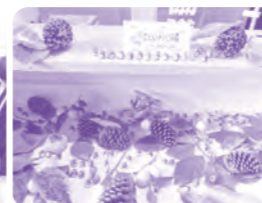
ドングリトトロの森