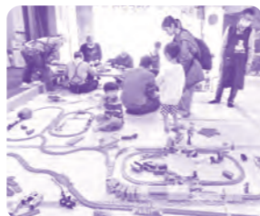
おもちゃドクター