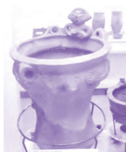
相模原市立博物館寄託資料 個人蔵

れた投影機は「10億個の星々×8Kデジタル映像」を映し出す世界最高峰のシステムだそうです。音響なども改装されたので、美しく迫力のある演出が楽しめる年間パスポートも発売されたそうです。最近では、ヨガや朗読、コンサートなどのコラボイベントも毎月行っているそうなのでHPをチェックしてください。常設展示は、考古・歴史・民俗・地質・生物・天文の6分野で構成されています。昆虫の標本や動物の剥製、昔の