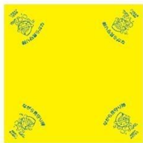
オリジナルバンダナ↓ (見本)←

相模原市の『ながら見守り活動』に登録されると、登録通知と「活動の手引き」、そして、オリジナルバンダナが郵送されます。