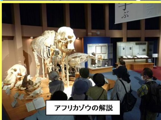
アフリカゾウの解説