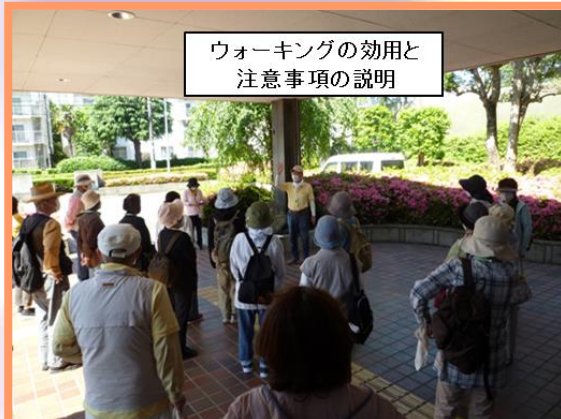
ウォーキングの効用と 注意事項の説明