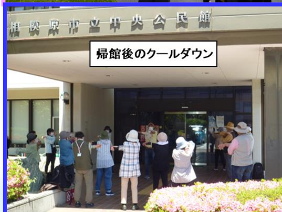
帰館後のクールダウン

ウォーキングコースは、コロナが5類に移行して初の事業であったため、体力の落ちた状況を考慮して、身近なエリアをお散歩的に巡る内容で設定しました。