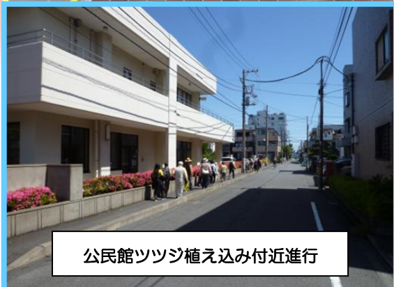
公民館ツツジ植え込み付近進行