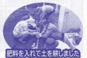
肥料を入れて土を耕しました