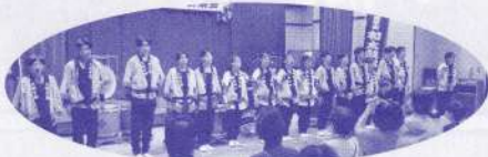
アンコール演奏が終わり、勢ぞろい