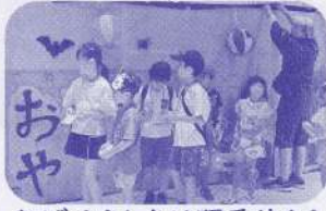
おばけやしきは順番待ち！