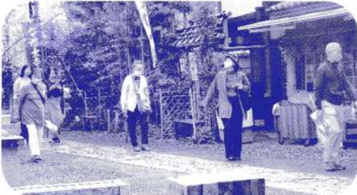
なごみ学級のお楽しみは、 社会見学バス旅行。 《写真は》 (左上)深大寺本堂前 (右上)楽しい昼食風景 (左下)深大寺周辺を散策 (右下)世界の水ギャラリー 見学の様子