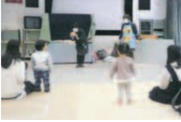
次は何が出るかな〜?