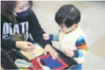
しっかり消毒した手で…