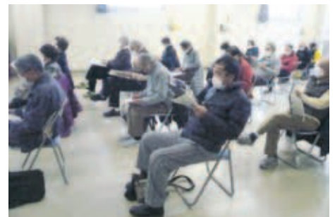
熱心に耳を傾ける受講者の皆さん

定員を30名まで減らし、「地域を知る もっと知る」をテーマに「歴史講座」が3年ぶりに開催されました。