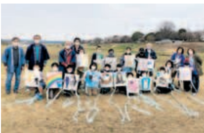
相模の大凧まつりの会場の一つでもある新戸スポーツ広場にて「みんなで凧あげ大成功!!」