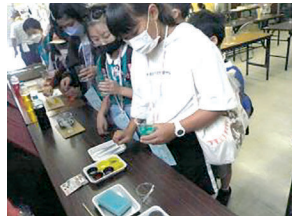
キラキラスライム