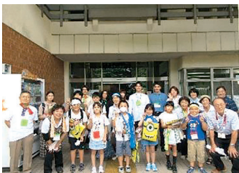
クルー全員で集合写真

ブースはそれぞれ、「ギョギョッとフィッシング&迷路」(ゲーム)・「スライム&折り紙」(工作)・「笑点商店」(パン・飲み物の販売など)・「都市伝説展覧会」(おばけ屋敷・おはなし会を設けました。約2か月間、ゆめッ子ひろばの子ども実行委員であるクルーをはじめ、青少年指導委員や協力員の皆さん、そして青山学院大学の実習生が協力し合い形にすることができました。定期的に集まって準備を進めるなかで、子どもたちはどんどん頼もしくなり、素敵な姿をたくさん見られました。準備は大変なこともありますが、「来年もクルーとして参加したい」という声が多く聞かれ、本当に嬉しいと感じます。今回スタッフとして経験した皆さんも、興味をもって下さった皆さんも、ぜひ来年のゆめッ子ひろばに関わっていただけたらと願っています。