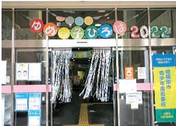
ゆめッ子ひろば入り口