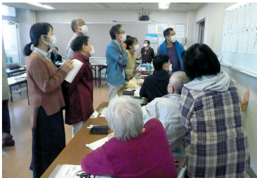
選句の時間：皆さん熱心に選んでいました