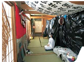
こわ〜いお化け屋敷