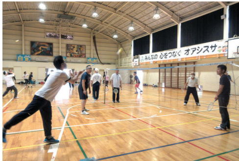
ラリーが続きます

当日集まったのは19人、親子で参加した方もいました。スポーツ推進委員の指導で、練習試合等を行いました。3分の1は初心者でしたが、皆さん最後まで楽しんで盛りに上がりました。