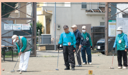
5月12日(金) 淵野辺本町ふれあい広場

優勝 Aブロック 共和南町 Bブロック 淵野辺 Cブロック 中淵 Dブロック 淵野辺銀盛会