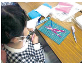
細かい作業も根気強く