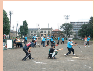
5月21日(日) 大野北中学校グラウンド