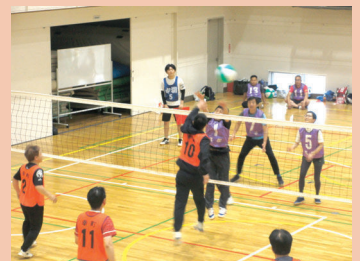
6月11日(日) 大野北中学校体育館