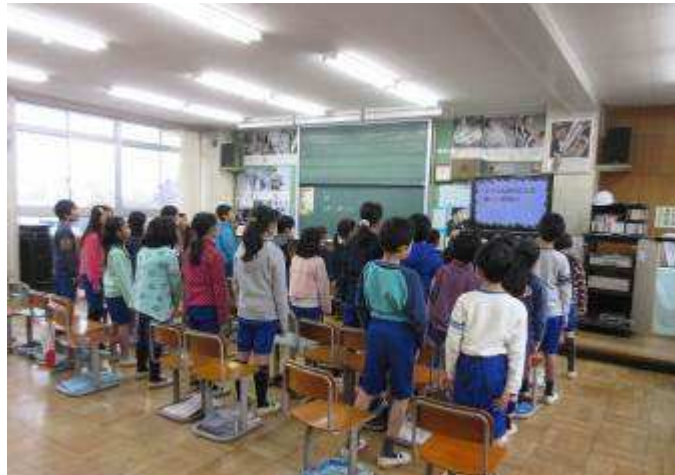
みんな元気！鶴の台小学校 4年生のみなさん

第34回大野南公民館まつりが3月4日(土)・5日(日)に開催されます。テーマに『みなおそう 地域のつながり 公民館』を掲げ、実行委員会では着々と準備が進んでいるところです。さて、今年はゲストとして、鶴の台小学校のみなさんにステージ出演していただくことに決まりました。地域交流の輪が広がりますます活気づく公民館まつり。皆さまお誘いの上、ぜひお出かけください。