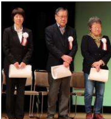
第 35 回大野南公民館まつ りで表彰を受ける皆さん