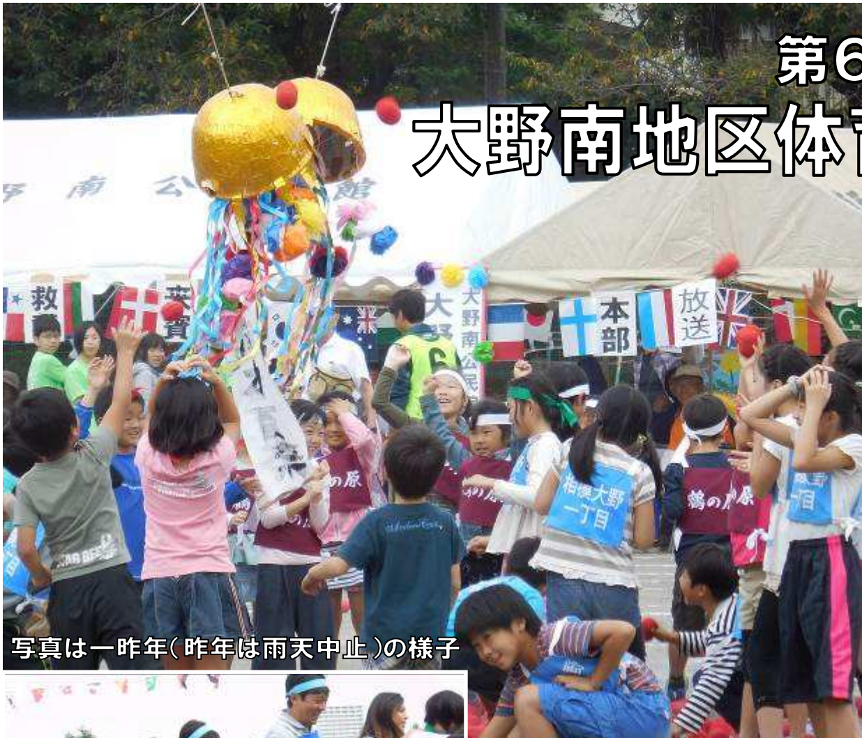
写真は一昨年(昨年は雨天中止)の様子