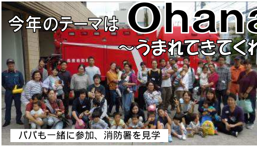
パパも一緒に参加、消防署を見学

家庭教育支援事業「大野南公民館子育てを楽しむ講座」が9月6日から10月25日まで全8回にわたり24組の参加で、大盛況のうちに終了しました。今年のテーマは、『Ohana』うまれてきてくれてありがとうです。「Ohana」(オハナ)とは、ハワイ語で「家族」にあたる言葉です。血縁関係がない者も含んだ意味での家族と、世代を超えて営々と続くというところが強調される、深い意味を持った言葉です。