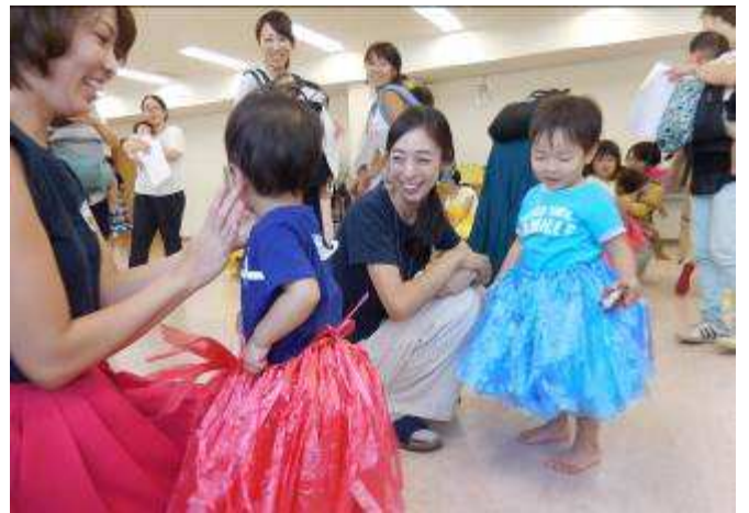
腰みのをつけて喜ぶ子どもたち

内容は、親子で楽しめる「簡単ほうとうづくり」や、いのちの大切さを学ぶ「いのちの話」。「子どもの緊急時の対応」では、パパも一緒に心配蘇生法やAEDの使い方を学びました。こどもの発達を促しつつ親子のコミュニケーションを図る「前向き子育てプログラム」や、こどもの薬の基礎知識、「手形・足型で思い出づくり」など多岐に渡っています。講座を通じて、ママたちの仲間づくり、情報交換、悩み相談などを行うことも大切な目的の一つです。受講生の皆さんの感想を少しだけ