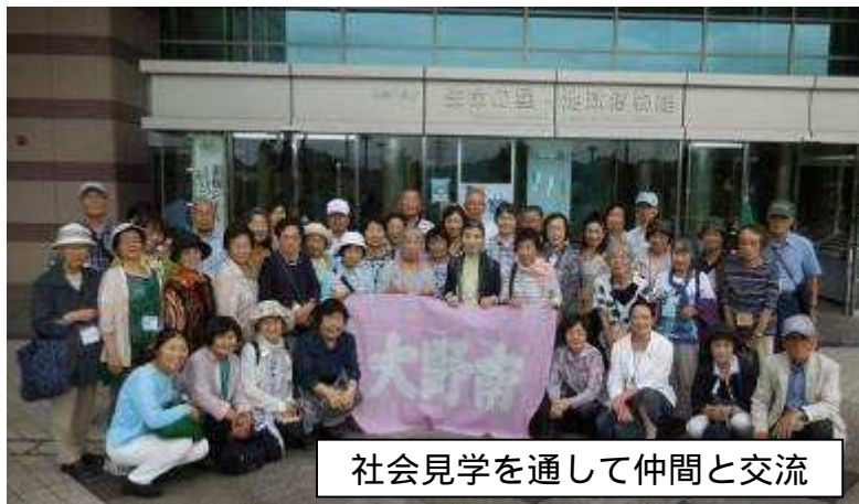
社会見学を通して仲間と交流