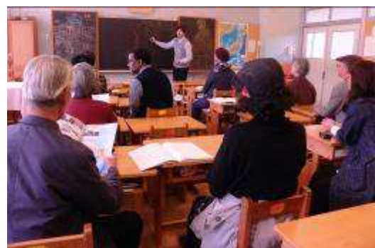
社会見学ではシュタイナー学園も

大野南公民館仲間カレッジは、成人を対象とした学級です。平成 30 年度は、「自分探し、まち探し」をテーマに、全 12 回の学級でした。基調講義「私たちにとって