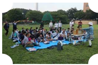
セミの羽化観察教室

ひにち 第 1 回 7 月 20 日 (土) 第 2 回 8 月 18 日 (日) 時 間 午前 9 時 30 分 ~ 正午 と ころ 鶴の台小学校 体育館 内 容 ファミリーバドミントンの ルール説明と練習 対 象 館区内の小学 4 年生 ~ 大人 (3 年生以下は保護者同伴で ご参加下さい) 定 員 なし 参加費 無料 持ち物 体育館履き、飲み物、汗拭き タオル * 運動しやすい服装で 申込み 直接または電話で公民館へ