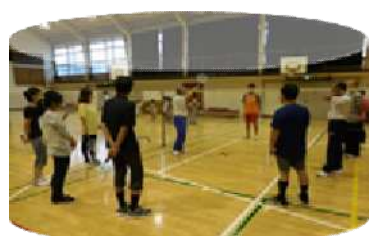
ファミリーバドミントン教室

抽せんの催し物は、必ず抽せん結果を問い合わせてください。問い合わせがないとキャンセル扱いになります。