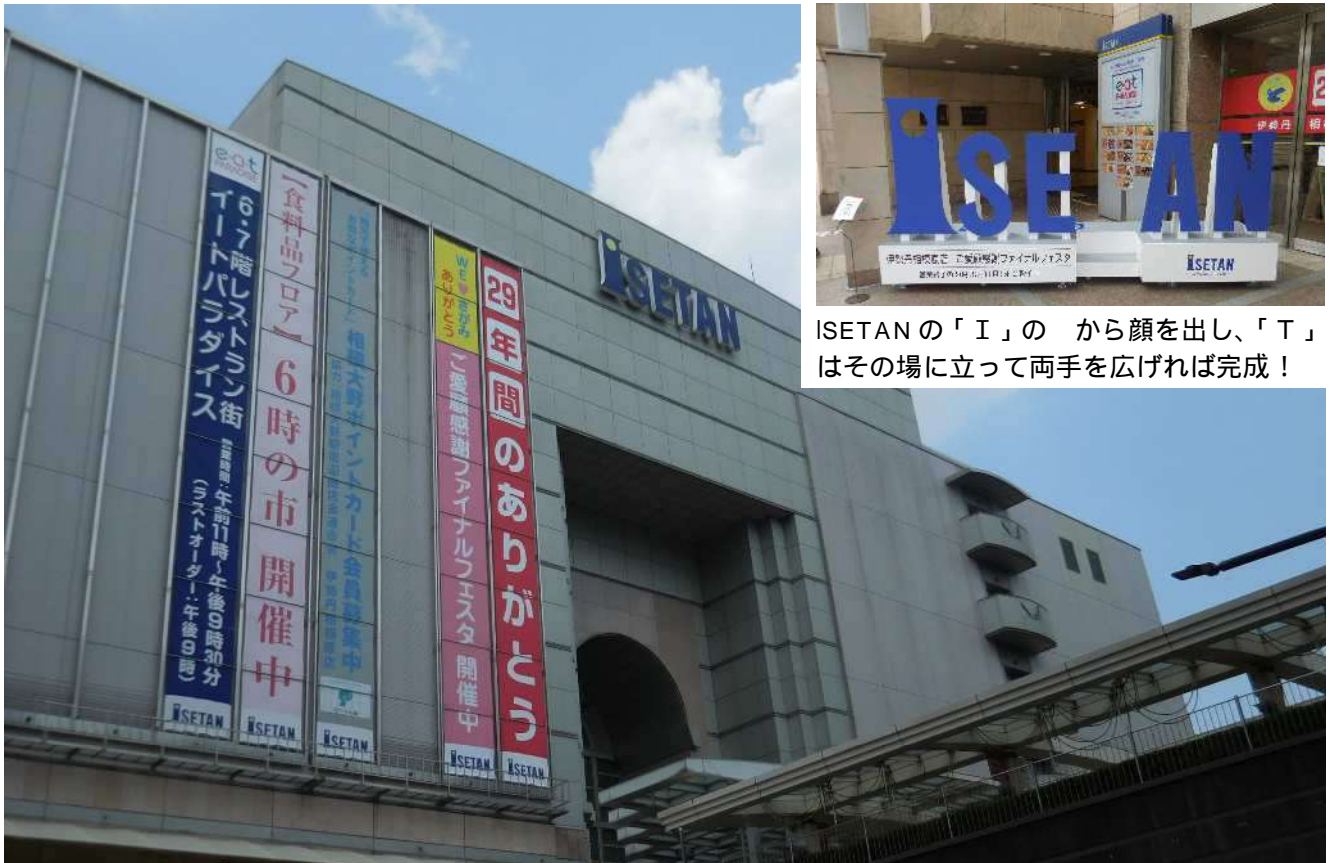
ISETAN の「I」の から顔を出し、「T」はその場に立って両手を広げれば完成！