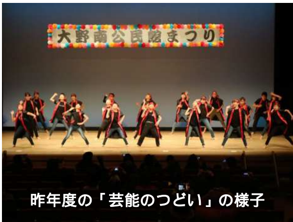
昨年度の「芸能のつどい」の様子