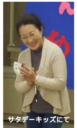
サタデーキッズにて

保育室は婦人学級で「学習権」を学んだ方々の「子育て中の母親に学習権の保障を」との熱意に