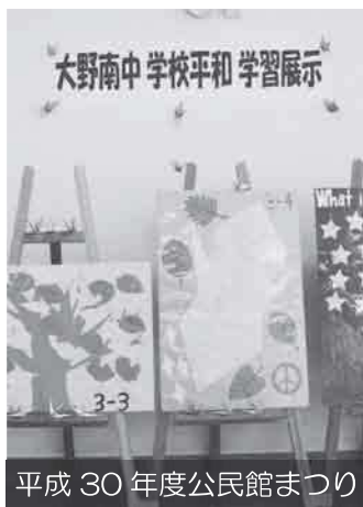
平成30年度公民館まつり

第38回大野南公民館まつりの文化展を3月2日(火)から7日(日)までの6日間開催します。今年度は新型コロナウイルス拡大防止の観点から、音楽のつどいの部、芸能のつどいの部、団体活動発表・展示の部は中止で、文化展の部だけの開催となります。もちろん3密を避けるため、展示の仕方を工夫するなどをしての開催です。是非ご来館をお待ちしています。 ■参加団体 写真 楽しく撮ろう会、風景写同行会、ひよ子第三保育園 絵画 一絵会 書道 書道同好会 墨絵 水墨画同好会 また、館区内の小中学校(大野南中、新町中、谷口台小、鶴の台小、青少年相談センター)の児童、生徒の作品を展示する予定です。※新型コロナウイルスの感染状況により中止となる場合があります。