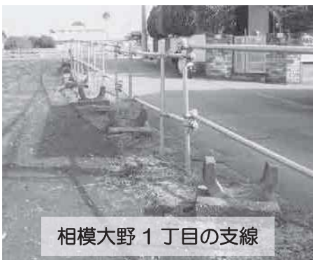
相模大野 1 丁目の支線