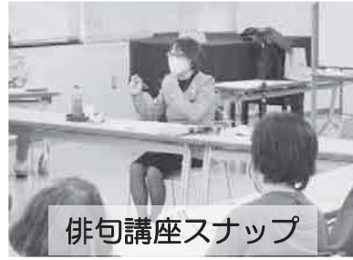
俳句講座スナップ

講座は最初に俳句の歴史や句づくりのポイントなどの俳句の基礎を学び、2回目は相模大野中央公園での吟行、3回目は句会が行われ、俳句の初歩を学びました。