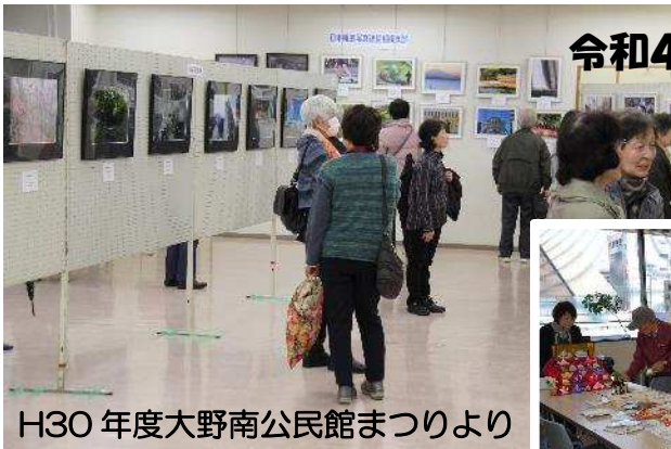
H30 年度大野南公民館まつりより

令和4年 3月3日(木) 午後2時から4時、 4日(金) と 5日(土) 午前10時から4時、 6日(日) 午前10時から午後2時 場所は 大野南公民館2階