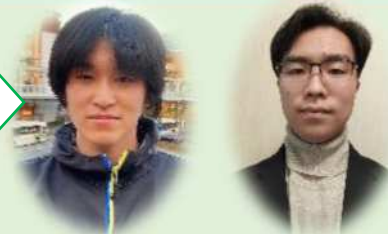
【委員長】 and 【副委員長】