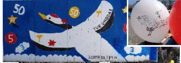
風船は土に還ります届いた方はラッキー

3月23日、谷口台小学校で、5年生がシビックプライドを学習する中、花火の打ち上げが発案され『上げれーさがみのおの花火』と題し、卒業式の日の夜空に向かって花火が打ち上げられました。打ち上げられた瞬間の音や華やかさに、児童や保護者とも心から感動していました。