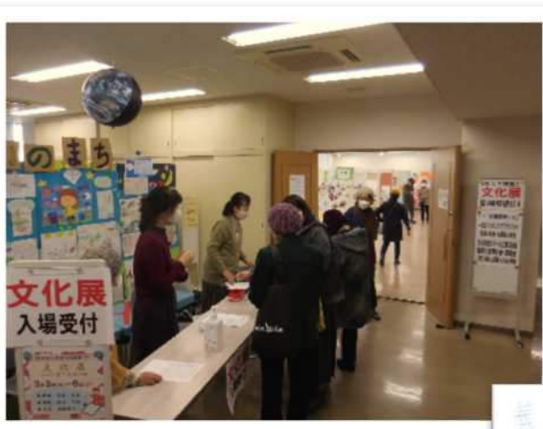
受付で検温・手指消毒・人数制限を実施

新型コロナウイルスの影響で2年連続中止となっていた大野南公民館まつり。前号の館報みなみでお伝えした通り、南市民ホールを使わず、音楽のつどい、芸能のつどい、活動発表を行わない、展示形式「文化展」で実施することができました。止まってしまった「公民館まつり」が再び動き出しました。