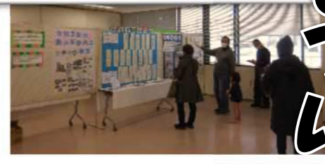
活動の成果にお互い刺激を受けます

今の困難な世の中、雷雨の後には綺麗な虹がでるように明るい光はすぐそこまで来ている。地域の輪で負けずに進んでいきますように。