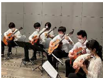
UnisOno (ギターアンサンブル)