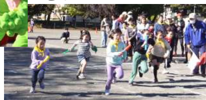
体育祭の花形！オールリレー！各チーム俊足代表が出場！大きな声援にあふれました。