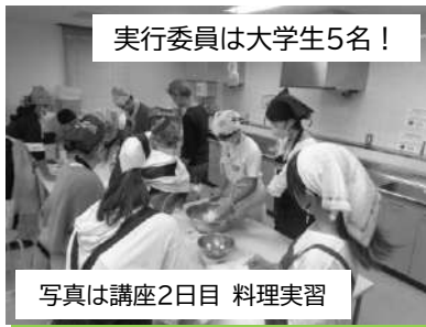
実行委員は大学生5名!

10月7日(土)~10月9日(月) 参加者 大人・中学生・高校生5名/小学生6名