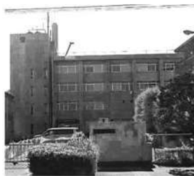
相模原南警察署の移転予定地 (現高相合同庁舎)

行幸道路沿いにある「県の高相合同庁舎」が老朽化のため、建て替えが進められています。その敷地の一部を活用し南警察署の移転が予定されています。完成は令和11年度以降。南区合同庁舎・南消防署の近くとなり、利便性が高まります。