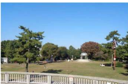
相模大野中央公園現況

相模大野のシンボルの一つである「相模大野中央公園」も整備から30年以上が経過しており、市では令和7年までの改修を予定しています。 伊勢丹が閉店した中、未来の相模大野のまちづくりを考える上で、相模大野中央公園の魅力向上は重要なテーマの一つです。老朽化対策も含め、その取組については地域の皆さんも関心あることと思います。