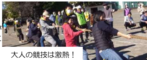
大人の競技は激熱！