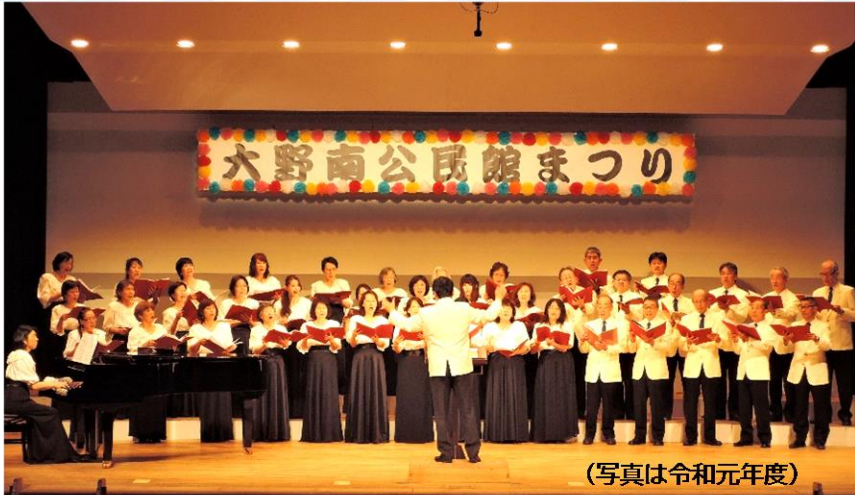
(写真は令和元年度)