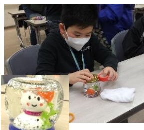
スノードーム完成品 (作品と写真の児童は無関係です)

12月2日、約100名の利用団体の皆さんで日ごろ使っている部屋を丁寧に掃除しました。当日以外の座布団カバー洗濯や漂白作業などのご協力もありがとうございました。