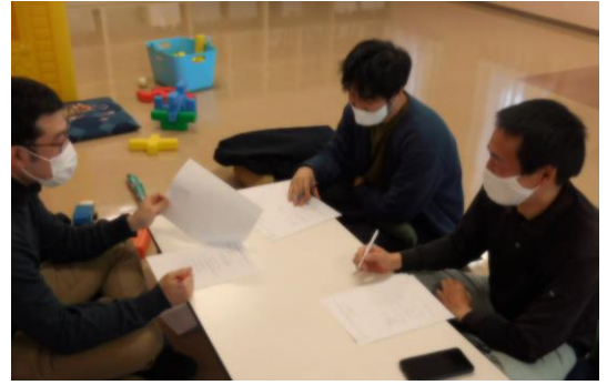
↑実行委員会打合せの風景↑ 「理想の家庭」「学びたいこと」「パパだからできること」「余裕=充実」などたっぷり話合いました。

近年、子育ての現場にパパが増えてきました。当館の子育てを楽しむ講座にもパパの姿が増えつつあります。今年の子育て講座に参加したパパを中心に、パパによるパパのためのパパ講座が立ち上がりました! 実行委員のパパたち、今の、これからの子育てで課題解決のヒントとなる学びを計画中です。ご参加ください!