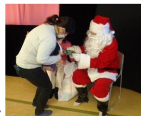
赤ちゃんにプレゼントを渡すサンタさん 微笑ましい光景です

大野南 サタデーキッズルーム 12月23日(土)子どもを含め39人の参加がありました。当日は、サンタと一緒に記念撮影に親子の列は途切れず、大盛況で終わりました。