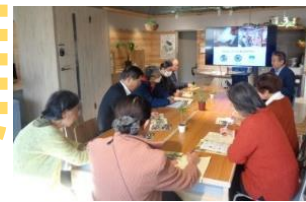
社会見学での様子

準備委員が社会の課題を幅広く拾い上げ、人と人がつながりあうことで豊かな人間関係が生まれ、より良い社会になるよう学級生が語り合いました。最後に、学級生でお食事会ができたことがより豊かな人間関係が出来た何よりの証でしょう。来年もよろしく。