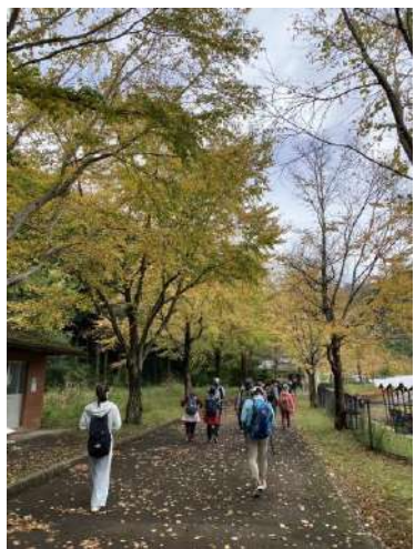
みんなで歩くと気持ちがいい！

秋のさわやかウォーキングを開催しました。 小田急線で渋沢駅まで移動し、桜土手古墳公園を経由して秦野戸川公園まで水無川沿いの遊歩道をいくコースです。 「ゴールの公園では始まりかけた紅葉が陽に輝いてとてもきれいでした。」