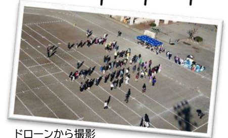
ドローンから撮影