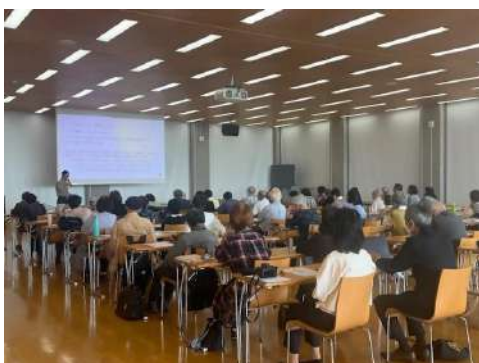
参加者は先生のお話を熱心に聞いていました