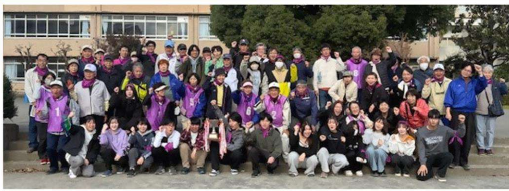
運営スタッフ大集合!