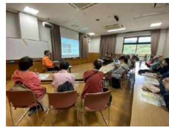
秦野の歴史、現地で受講中