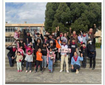
優勝した赤チーム! 🏆

会場提供や備品使用等で多大なご支援を頂いた大野南中学校様、事前準備も含めご協力を頂いた学生ボランティアや地域住民の皆さま、ご参加いただいた全ての皆さまに心より感謝申し上げます。