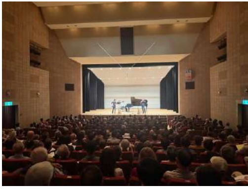
拍手喝采！音楽の力に癒されました

何よりも、このコンサートをこんなにも長く続けて下さり、そこで演奏させて頂きました事に、感謝の気持ちでいっぱいです。公民館、実行委員の皆様、そしてお聴き下さいました皆様に、心より御礼申し上げます。 クラシック音楽が、身近で、気軽に楽しめるものであってほしい、というも思っています。と同時に、良く知られている曲に限らず、多くの素晴らしい作品を紹介したく、プログラムを考えてきました。