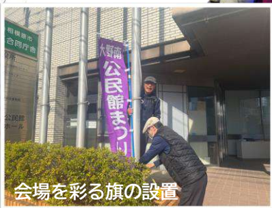
会場を彩る旗の設置