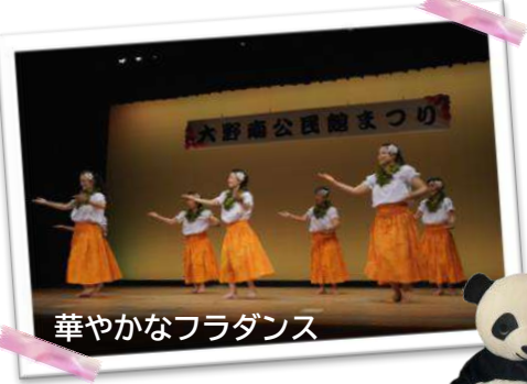
華やかなフラダンス