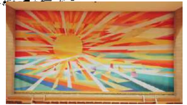
緞帳「陽と水と緑の饗宴」