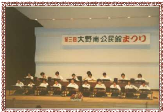
第3回公民館まつり