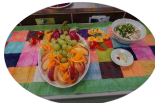
果物を鮮やかなカットで盛り付けました。