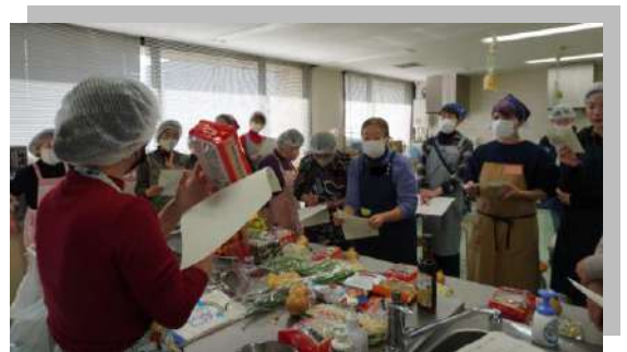
これからおいしいフォーを作しましょう!