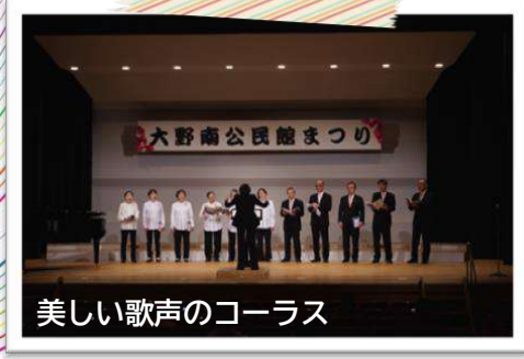
美しい歌声のコーラス