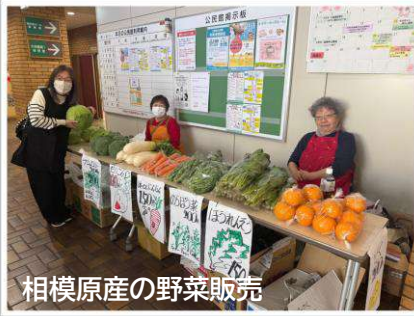
相模原産の野菜販売