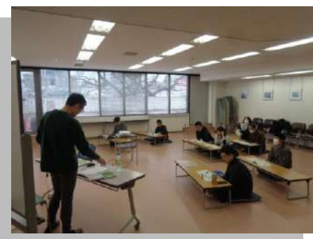
感情マネジメント、勉強中