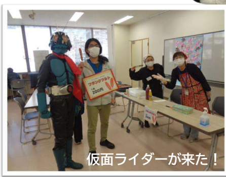
仮面ライダーが来た!