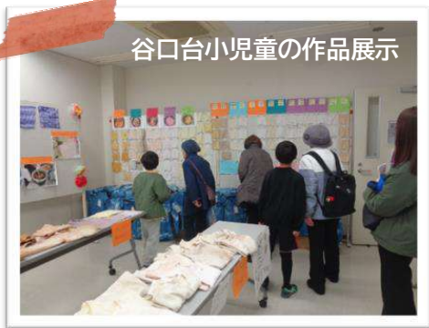
谷口台小児童の作品展示