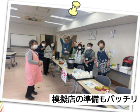
模擬店の準備もバッチリ!