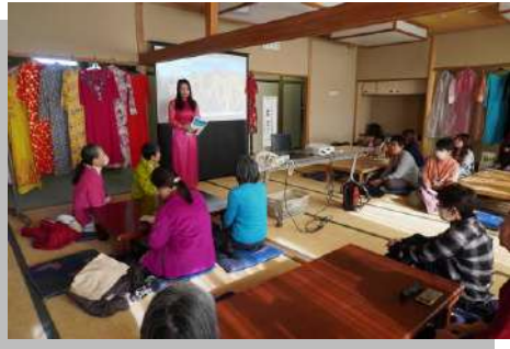
ハーさんの話から、見えてくるベトナムの文化を満喫です。

一日目は、旧正月の準備や風習を紹介しながら、アオザイや工芸品、テト飾りを手に取って楽しんでいただきました。地域ごとの文化の違いやお正月についても多くのご質問が寄せられ、皆さまがベトナムをより深く知ろうとしてくださいていることを強く感じました。アオザイを試着した瞬間に表情がぱつと明るくなり、会場に柔らかな空気が広がった場面は、まるで故郷の温度が届いたようで忘れられません。