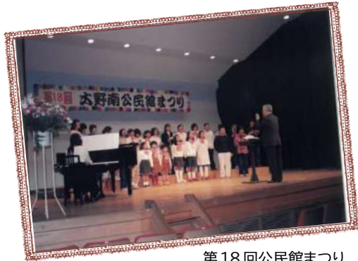
第18回公民館まつり