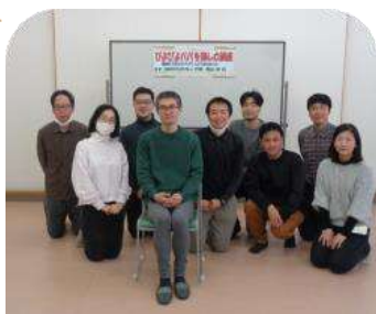
参加者&実行委員で集合写真♪