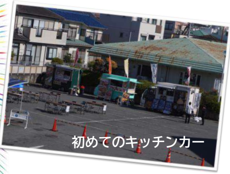
初めてのキッチンカー