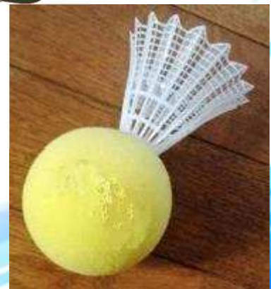
スポンジのシャトルを 打ち合うスポーツです