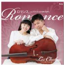
① ロマンズ ～ピアノとチェロの夢の世界～