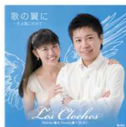
③ 歌の翼に ～そよ風にのせて～