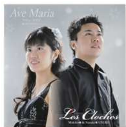
② アヴェ・マリア ～愛と喜びのメロディ～