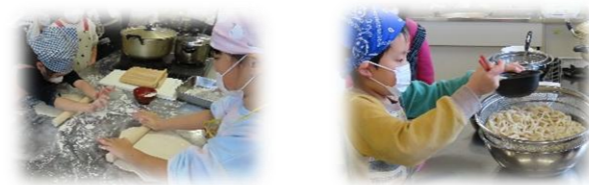
つくってたべよう♪てうちうどん

2月1日(日)、ほねごりアリーナ(北総合体育館)にて開催され、6自治会(うち2自治会は合同)の5チームが参加しました。試合では、普段とは違う相手との対戦を楽しむ声も聞かれ、自治会交流とともに会場は大いに盛り上がりました。