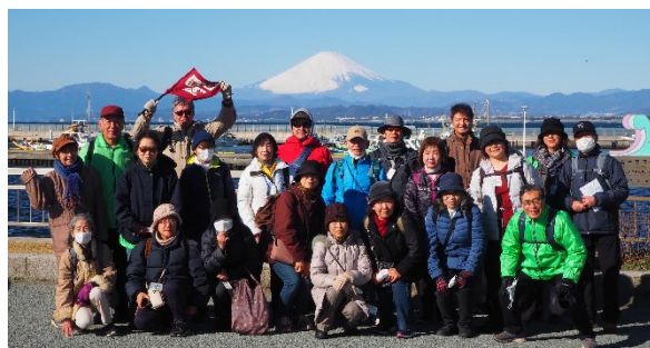
富士山を背景に集合写真を撮りました