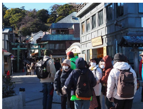
ここからはひたすら上りです