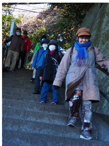
岩屋へと下ります