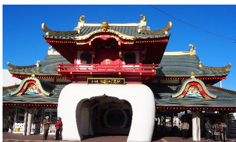
片瀬江ノ島駅の駅舎です

14名の参加者は、片瀬江ノ島駅から江島神社、サムエル・コッキング苑、岩屋までの往復6kmを歩きました。皆さんお疲れ様でした。