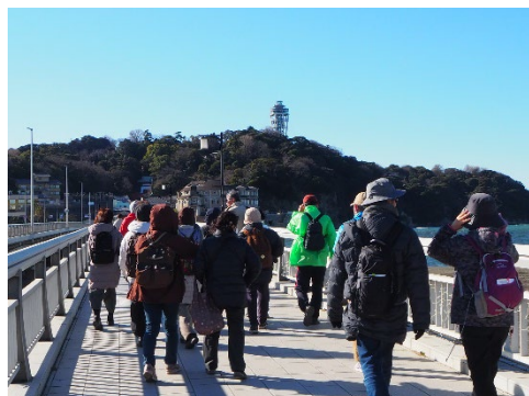
弁天橋を渡り江の島へ向かいます