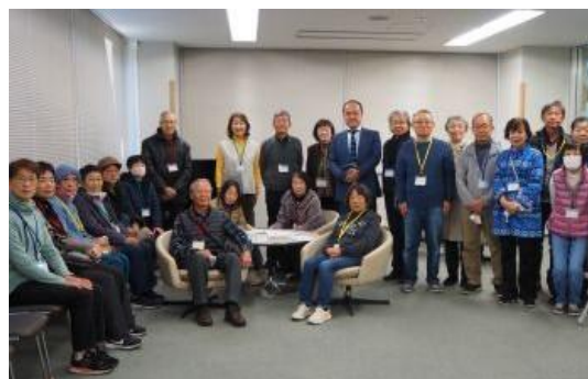
議会前の待機室で。傍聴準備は整いました。