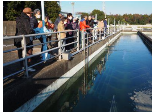
沢山ある沈殿池・濾過池。浄水までの段階を見て、初めて知る水の有難さ！