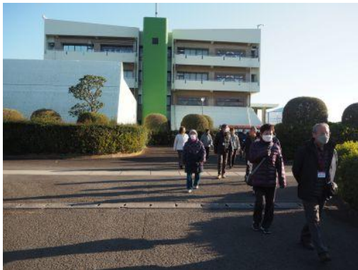
見学スタート。広く、手入れされた場内。