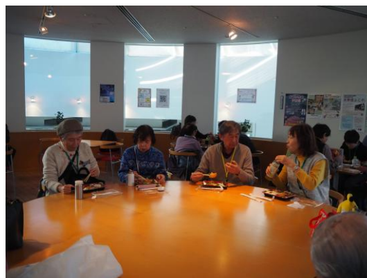
昼食を済ませ、プラネタリウムの開始を待ちます。