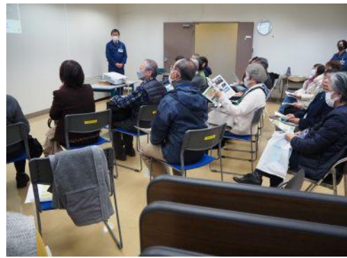
水ができるまでを学びました。