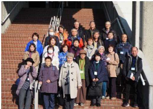
相模原浄水場で集合