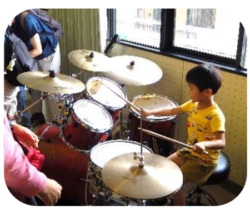
将来は名ドラマーかな