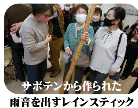
サボテンから作られた 雨音を出すレインスティック