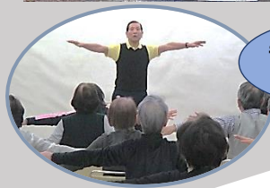
ラジオ体操の歴史