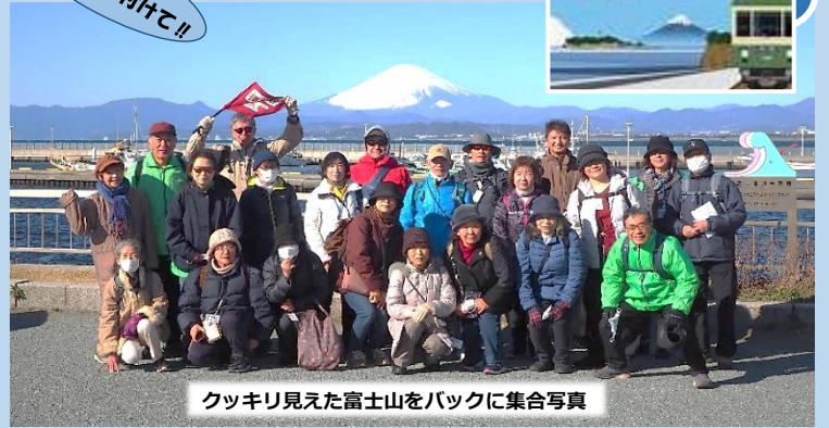
クッキリ見えた富士山をバックに集合写真