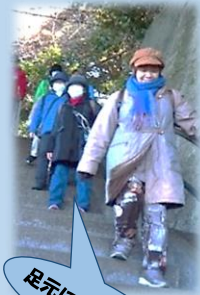
足元に気を付けて!!

江の島は石段の上り下りが多く、また総歩数1万歩以上で6時間という健脚者向けのウォーキングでした。