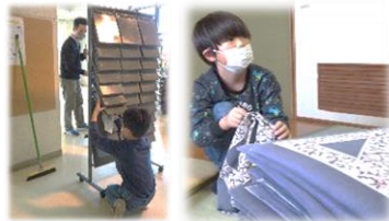
僕らも、お手伝いしているヨ

12月16日(土) 普段、公民館を利用しているサークル・団体が中心になって、大掃除が行われました。当日は、皆さんが協力して清掃を行い、館がきれいになりました。ありがとうございました。