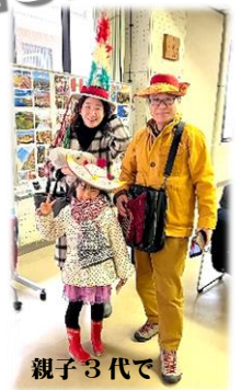
親子3代で 楽しみました

1月20日(土) Sonadores (ソニャドーレス)を迎えて実施されました。演奏だけでなく、衣装、楽器、中南米の文化などについて興味深いお話もしていただきました。3人とワンちゃん1匹の奏でる、素朴で幻想的なフォルクローレの調べに魅了された2時間でした。