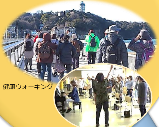
健康ウォーキング