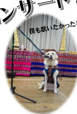
僕も歌いたかったな