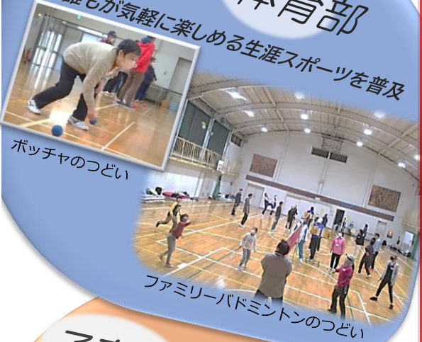
ポッチャのつどい