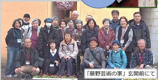
「藤野芸術の家」玄関前にて