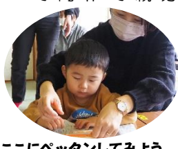
ここにペタンしてみよう

2月2日(金) 節分にちなんで、9組の親子が参加し、紙皿で『でんでん太鼓』を作成したり、丸めた新聞紙で『豆まき』をして楽しみました。