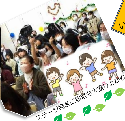
ステージ発表に観客も大盛り上がり