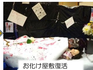
お化け屋敷復活 今年の舞台は病院