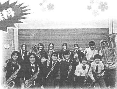
吹奏楽 中野中学校吹奏楽部の皆さん