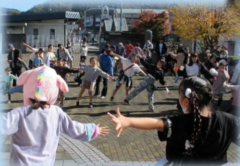
今年は子ども実行委員を 中心にダンス体験♪