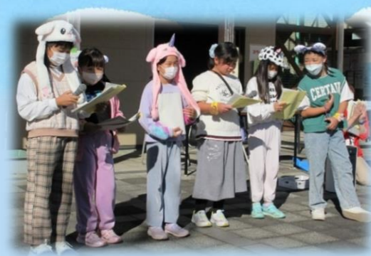
子ども実行委員 開会式にて!