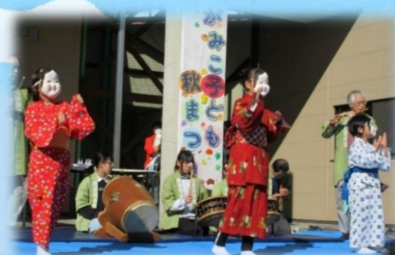
与瀬郷土芸能保存会の皆さん