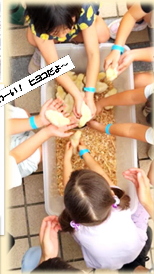
わーい! ヒヨコだよ~