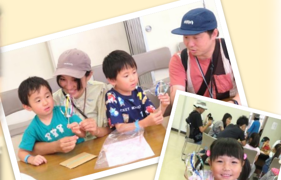
上手に出来たでしょ!