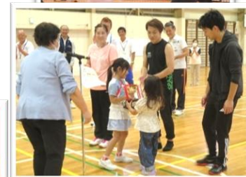
優勝: 町屋チーム 準優勝: 小松チーム 第3位: 公民館Bチーム