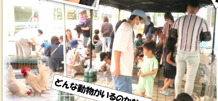
どんな動物がいるのかな?