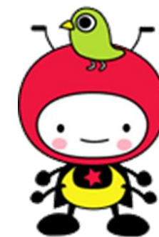
城山公民館イメージキャラクター 「しろっぴー」