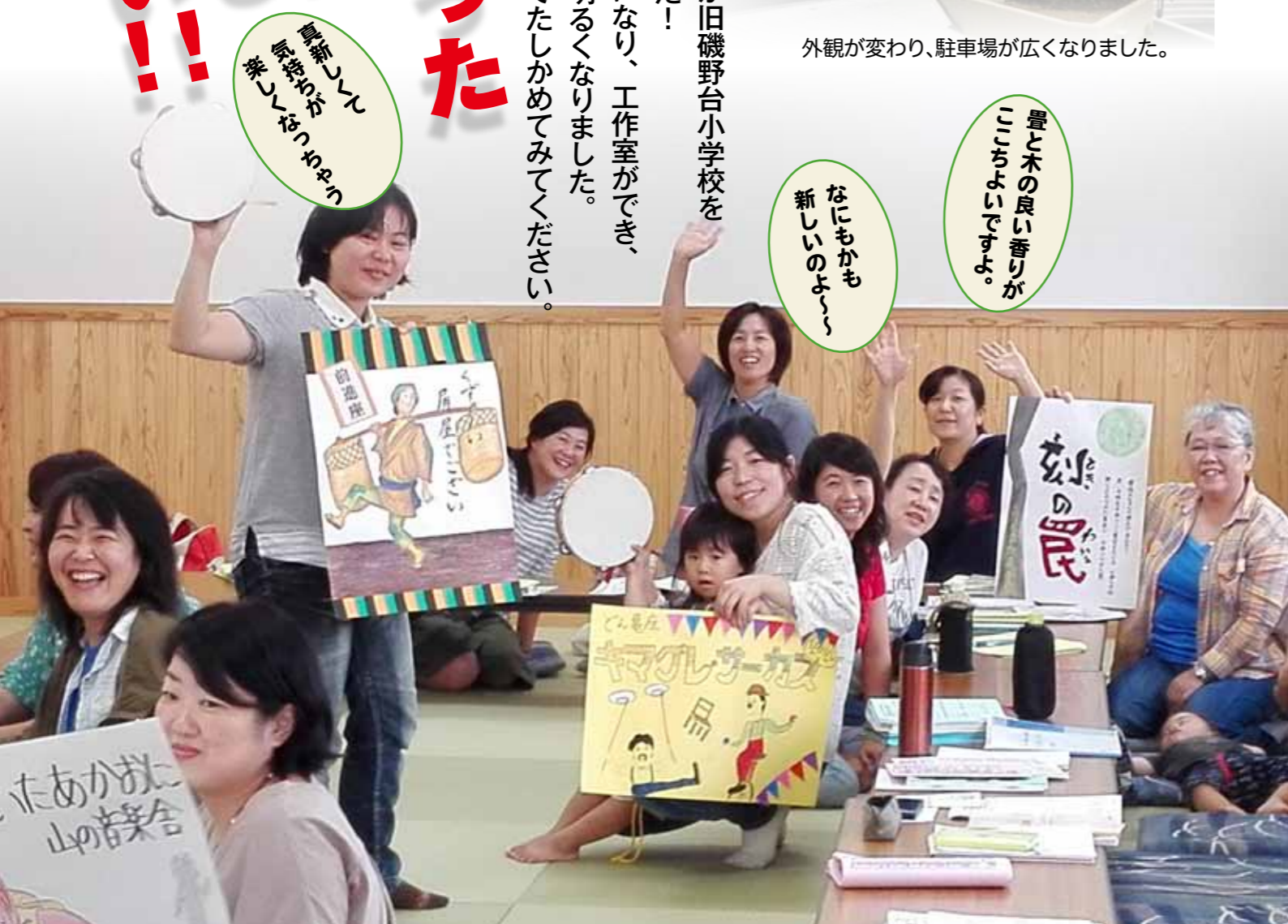
新しくなった和室にて