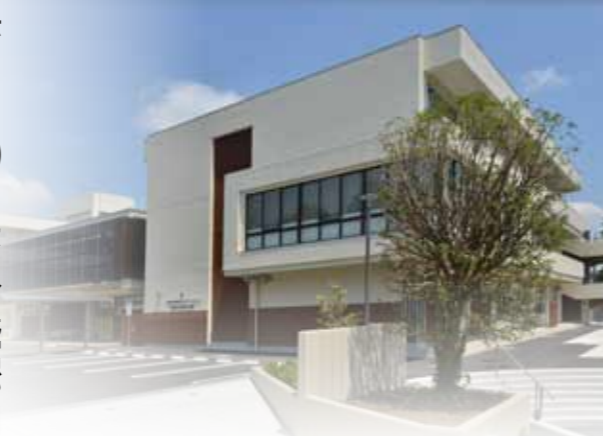
外観が変わり、駐車場が広くなりました。

去る9月20日に、公民館が旧磯野台小学校を改装してオープンしました！ 料理実習室がピッカピカになり、工作室ができ、防音室もあり、保育室は明るくなりました。 ぜひ来館してあなたの目でたしかめてみてください。