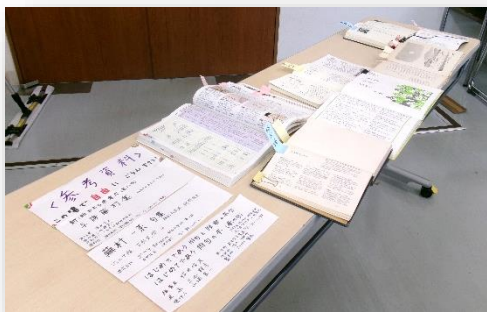
会場入り口には、先生が用意した詩吟に関する様々な資料を展示しました