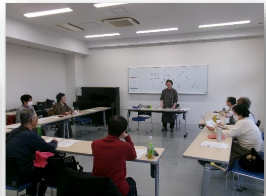
詩吟が初めての方も、ゆっくりと 詩吟の世界に入っていただける、 和やかな雰囲気の良い教室でした