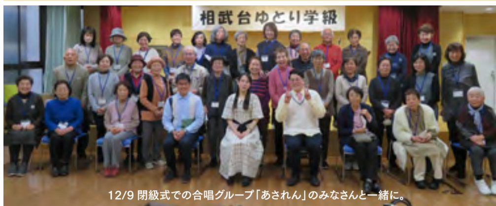
12/9 閉級式での合唱グループ「あされん」のみなさんと一緒に。

「元気で楽しい仲間たち！」をテーマに開級した、「相武台ゆとり学級」が全日程終了しました！楽しい音楽ではじまり、心に染みわたる音楽で終わった今回の学級。講師、出演者の皆様にご協力いただき、運営委員、学級生全員で盛り上げ、どの回も学びと笑顔いっぱいのステキな学級となりました。