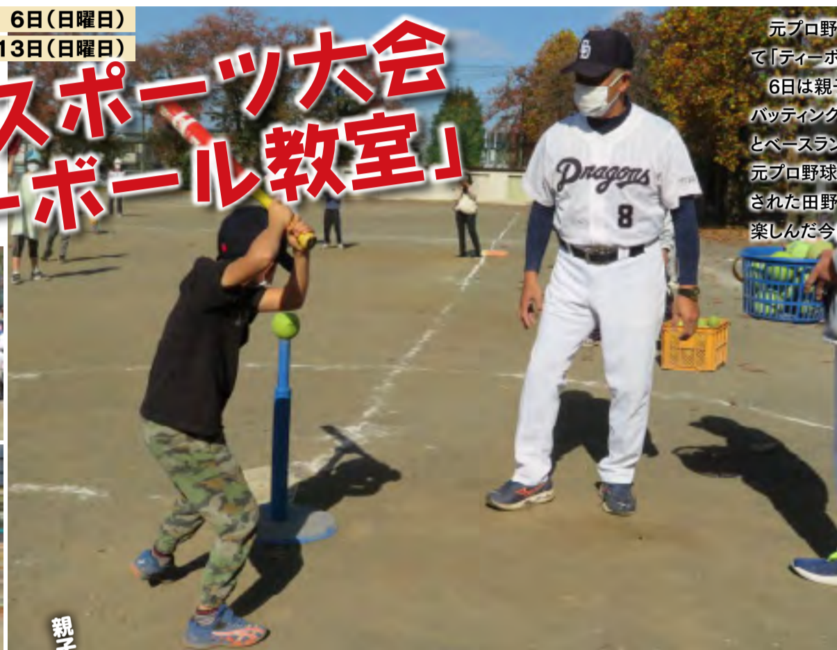
親子でキャッチボール