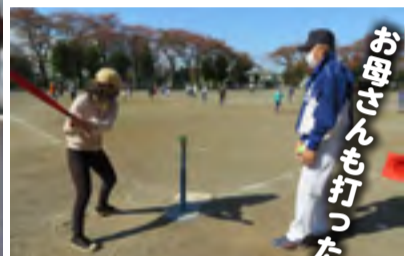
お母さんも打った〜！

6日は親子キャッチボールとベースランニング、バッティングの練習。13日は親子キャッチボールとベースランニング、体験試合をおこないました。元プロ野球選手として大活躍され、1軍コーチもされた田野倉さんの素晴らしい指導で、親子も楽しんだ今回の「ティーボール教室」でした。