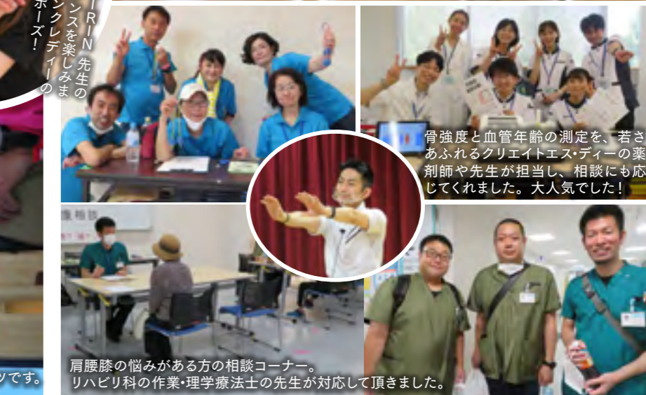
骨強度と血管年齢の測定を、若さあふれるクリエイティブ・ディーの薬剤師や先生が担当し、相談にも応じてくれました。大人気でした！