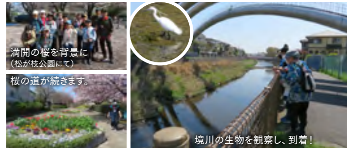
満開の桜を背景に(松が枝公園にて)桜の道が続きます。

当日は、絶好の桜見物日和でした。相模原、座間、大和をとおり、横浜水道みちを歩きました。小学生の参加があり、体育部員や参加者の皆さんとおしゃべりしながら、最後まで歩きとおしました。春を存分に味わったウォーキングでした。