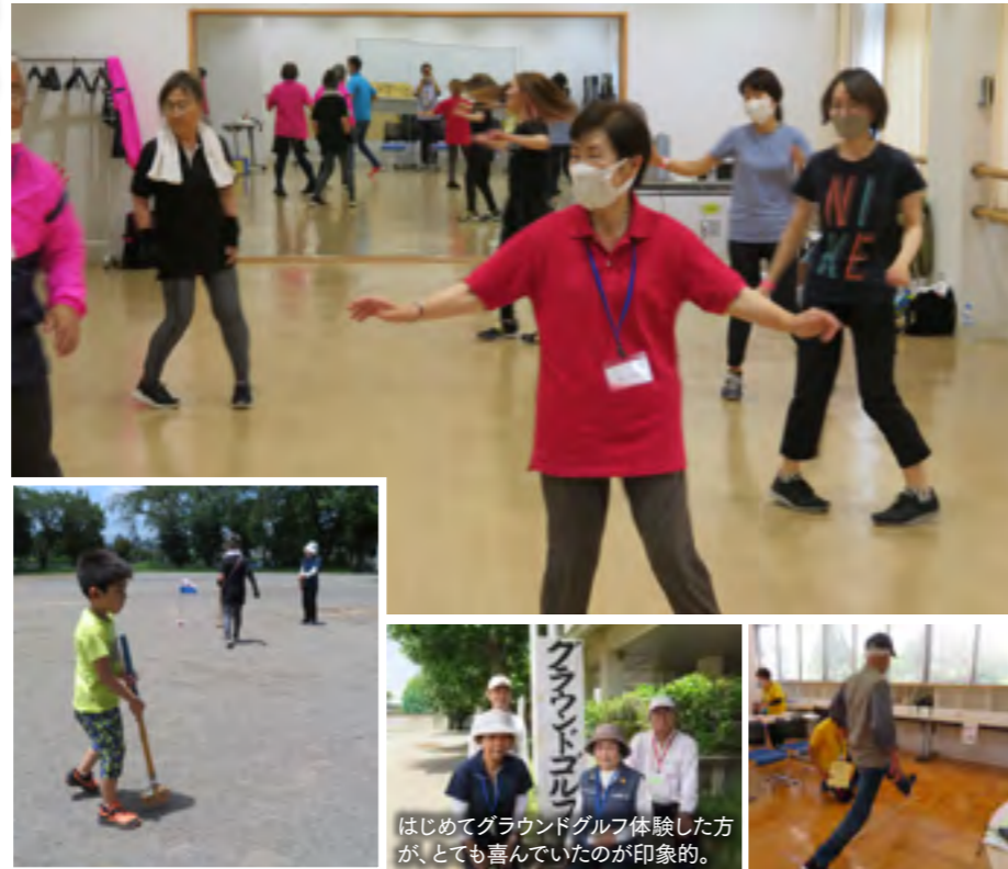
はじめてグラウンドゴルフ体験した方が、とても喜んでいたので印象的。

公民館とそあら体育施設の会場に設けられた「ダンスエアロ」「手浴」「骨強度・血管年齢測定」「握力・最大一歩・開眼片足立ち」「肩腰膝のリハビリ相談」「みんなで楽しい健康体操」「グラウンドゴルフ」「モルック」「ラダーゲッター」「ポッチャ」の10コーナーでは、健康や体力のチェック、スポーツ体験を楽しんでいただきました。