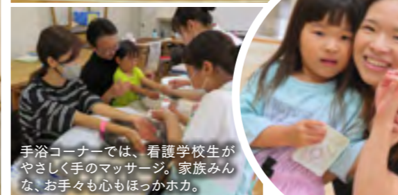
手浴コーナーでは、看護学校生がやさしく手のマッサージ。家族みんな、お手々も心もほっかほか。