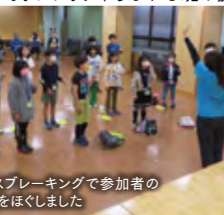
アイスブレーキングで参加者の緊張をほぐしました