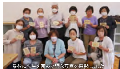
最後に先生を囲んで記念写真を撮影しました