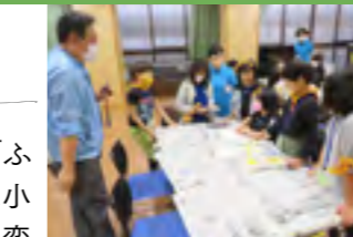
班の旗を作るころには、とても仲よくなっていました

参加者からは「はじめて来て最初は緊張したけれど楽しかった。」などの意見も聞かれました。これから1年間、様々な体験をつうじて、学年を超えた仲間づくりを行っていきます♪