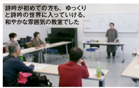
詩吟が初めての方も、ゆっくりと詩吟の世界に入っている、和やかな雰囲気の良い教室でした