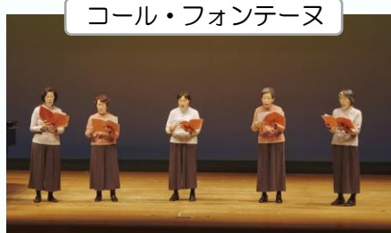
コール・フォンテーヌ