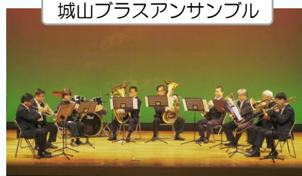
城山プラスアンサンブル