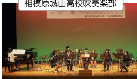
相模原城山高校吹奏楽部