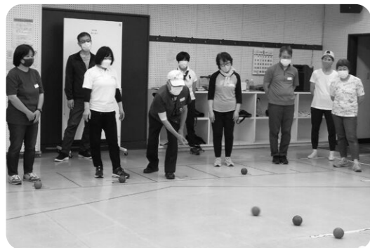
ジャックボールをねらって

公民館のホールを会場に、参加者24名が、ポツチャの競技ルールについての説明と簡単な練習の後、3名一組のチームを組んでゲームを楽しみました。 はじめのうちはボールの扱い方などわからないこともありましたが、練習することに参加者の腕があがってきました。誰でも参加できる親しみやすい競技ですが、いかにゲームを展開させるか考えはじめると何回トライしても飽きない奥深さがあります。後半にはちょっと頭脳戦もみられて今後が楽しみな講習になりました。(山)