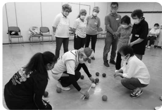
どちらが近いかな? きっちり測ります!

公民館のホールを会場に、参加者24名が、ポツチャの競技ルールについての説明と簡単な練習の後、3名一組のチームを組んでゲームを楽しみました。 はじめのうちはボールの扱い方などわからないこともありましたが、練習することに参加者の腕があがってきました。誰でも参加できる親しみやすい競技ですが、いかにゲームを展開させるか考えはじめると何回トライしても飽きない奥深さがあります。後半にはちょっと頭脳戦もみられて今後が楽しみな講習になりました。(山)