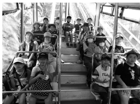
ダム下からインクラインに乗って!!

はじめての参加者が過半数を占めていましたが、ルール説明や基本の打ち方など、わかりやすく教えてもらえるので、後半の試合も大いに盛り上がりがありました。(山)