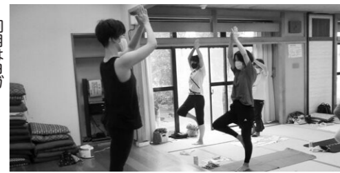
1回目はヨガ 心も体もリフレッシュ