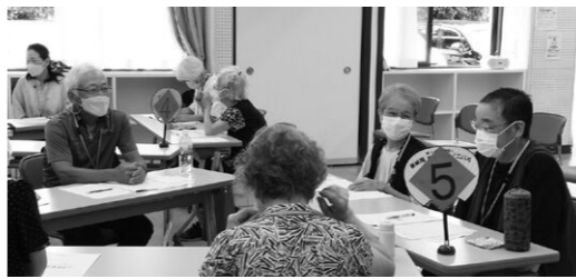
久しぶりの開級に笑顔

3年ぶりに東林高齢者学級が開講されました。定員等、以前同様とはいかないものの感染予防対策を取りながら開催にこぎつけました。 学級生は、はじめての参加者や再会を楽しみにしていた方等、36名が集まりました。 今年度は、全8回。健康体操や体力アップ、健康講話、ボッチャ、文学、折り紙など、様々なテーマに取り組んでいきます。